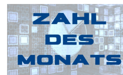
Hotelkennzahlen zu den Spielen der Euro 2024 in München